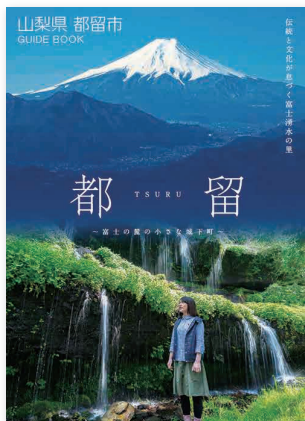
都留市観光パンフレット