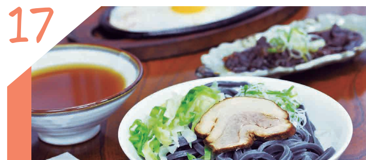
17 昔ながらの手打ちを進化させたコシと風味が自慢のうどん