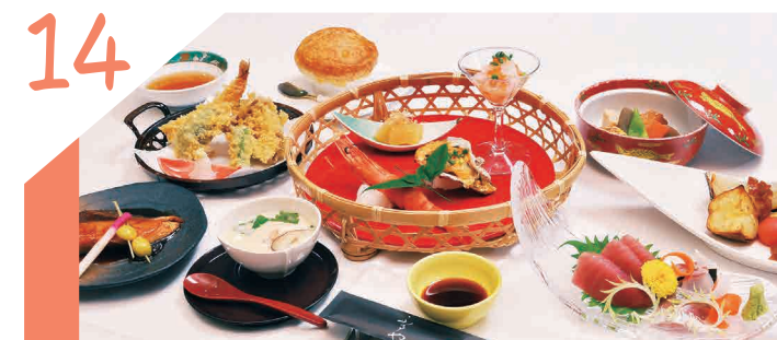
目と舌で味わう、歴史に裏付けされた確かな技術