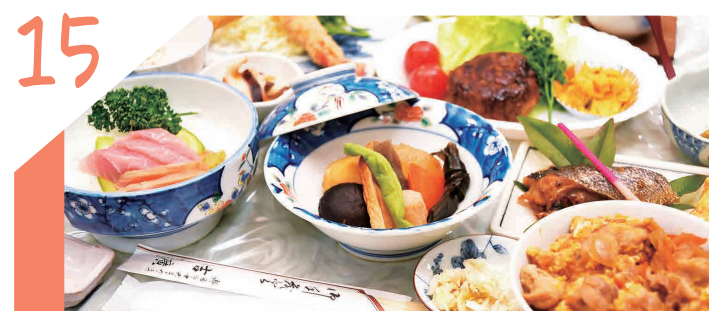
大型宴会も可能!大正時代から愛されるお店