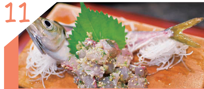
カウンターの水槽から活魚を調理!新鮮な魚を!