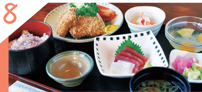
肉厚ジューシーな国産豚肉メニューは外せない逸品