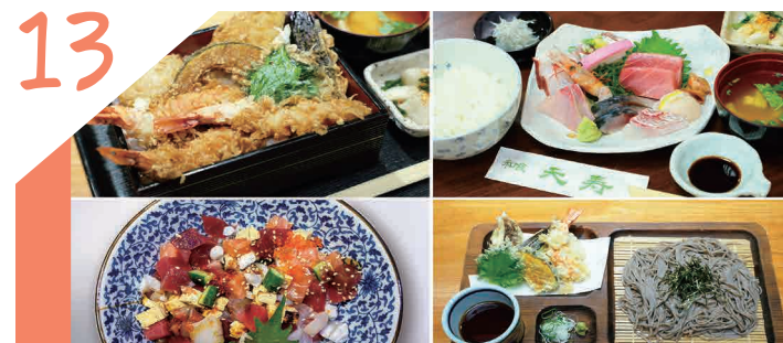
季節のお刺身・サクサク天ぷらを楽しめる