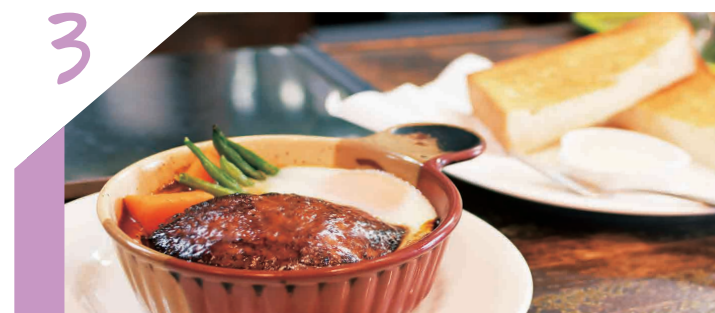
3 心もおなかも満たされる至福の洋食レストラン