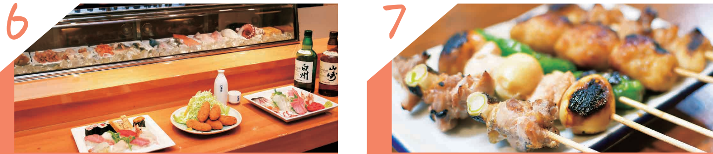
昔ながらの焼き鳥居酒屋!レトロな店内で一杯♪