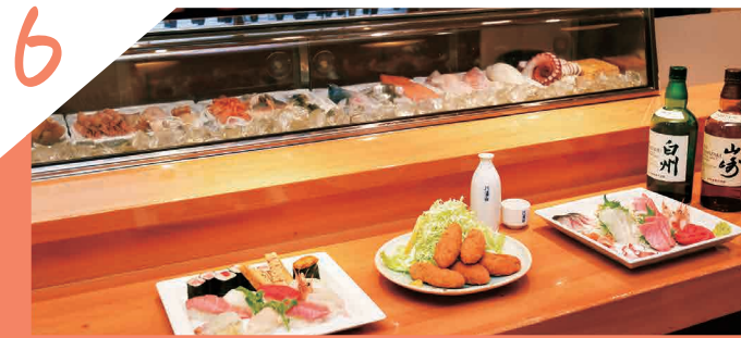
旬な魚を旬な時に刺身と寿司の「寿司もちづき」