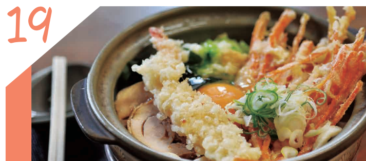
19 吉田のうどんを煮込みにしたボリュームも味も絶品のうどん