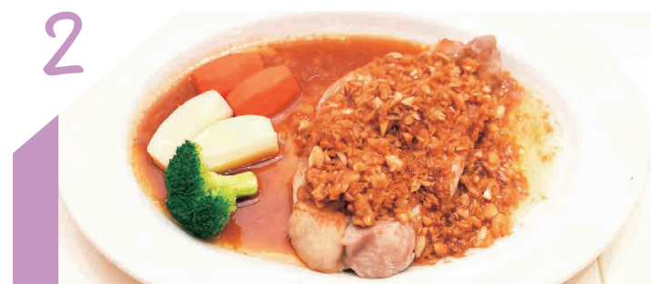
2 家庭的洋食レストランレゾール