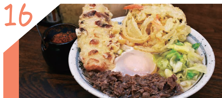
16 荻窪うどんの絶品吉田うどんをご賞味あれ!