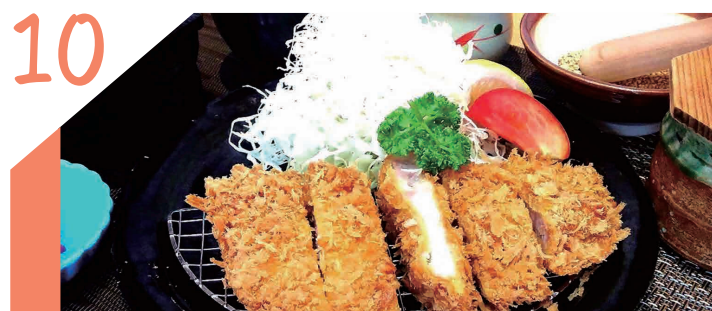
お酒も飲めて、ご飯も美味しく食べられるお店