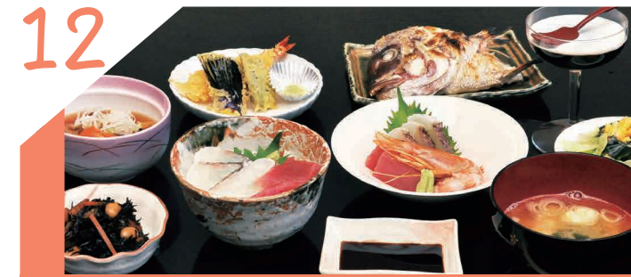
季節の食材を活かした料理の数々に酔いしれる