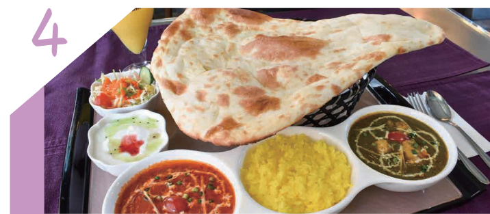
4 都留で本格インドカレーを味わうならここ!