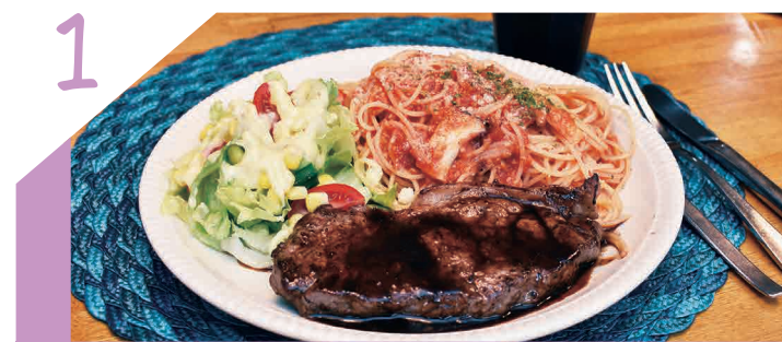
1 種類豊富なパスタメニュー 県内外から多くのファンが通う老舗店!