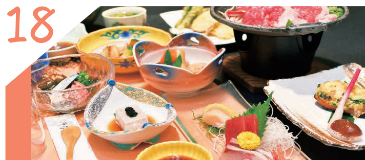
18 大小様々な会合・宴会・パーティー承ります