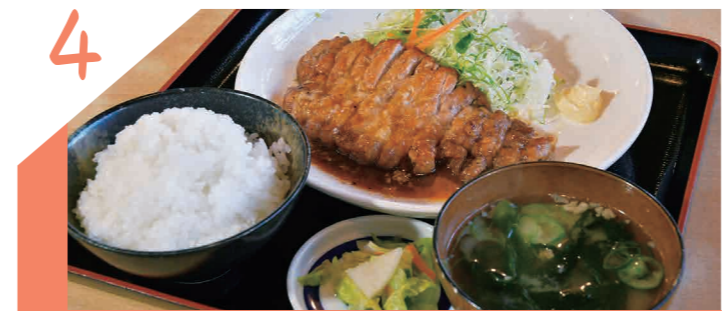
創業45年、地元へ愛される定食屋さん

食堂 くらき 手づくりにこだわった定食屋。肉も冷凍は使わず国産生肉にこだわった大ぶり「から揚げ」や、3種(生姜・にんにく・生姜&にんにくミックス)のソースから選べる「ポークステーキ定食」などが人気。リーズナブルかつボリューム満点なのうれしい。