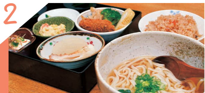
隠れ家のような「手打ちうどん店」、ホテルが見えるかも!?

手打ちうどん ほたる 「道の駅つる」や「リニア見学センター」近くの山沿いにあり、店裏の川でホテルが見られることが店名の由来。「得々セット」はリーズナブルでボリューム満点。どこか懐かしい「家庭のうどん」が楽しめる。都留市に来たらぜひ寄ってみよう!