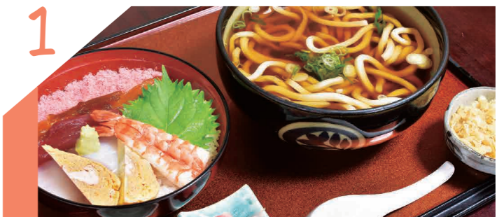
昼は会食! 夜は居酒屋!!

大衆割烹 春波 ランチタイムにはうどん付の定食や天丼・かつ丼などの丼ものをがっつり味わえる。新鮮な魚介や揚げ物、出汁にこだわったうどん・蕎麦などメニューが充実。最大30名まで入れる座敷もあり。写真の「うどんセット」は1,100円。