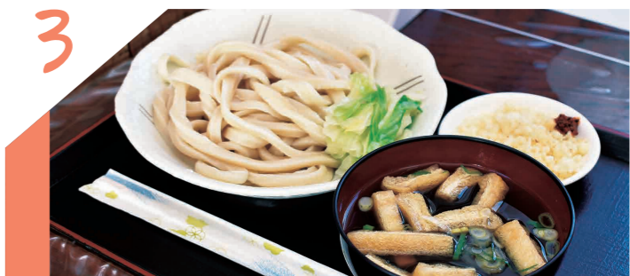
一度食べたらやみつき! これぞ本格吉田のうどん!

手打ち 山もとうどん その知名度は全国レベル。食べログうどん百名店に選ばれた山もとうどん。一度食べたらリピート間違い無し。手打ちの麺は噛めば噛むほど小麦の香りを感じられる。お店特製の辛味と揚げ玉がうどんにとてもよく合う。